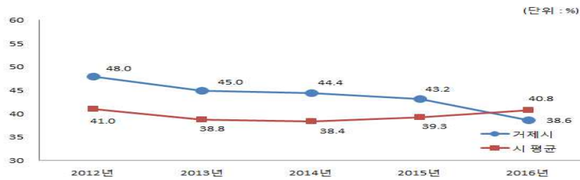
유사 지방자치단체와 재정자립도 비교

우리 시의 재정자립도는 하락 추세를 보이고 있으며 2016년도 동종자치단체 40.8%에 비해 2.2% 낮은 38.6%인데 이는 조선업 불황으로 인한 자체세입 감소가 원인 것으로 보입니다.