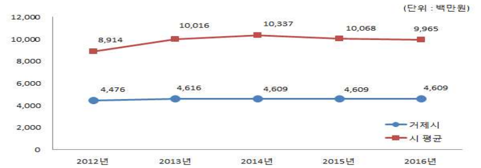
채권현황 연도별, 유사 지방자치단체와 비교

▶ 연도별 결산결과 채권현재액보고서 회계별 채권관리현황의 기준년도 현재액